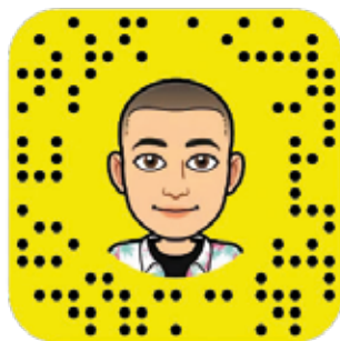
MPT DU PLAN